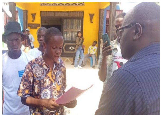
La lecture de la note de plaidoyer des enfants devant le bourgmestre de la commune de Lemba