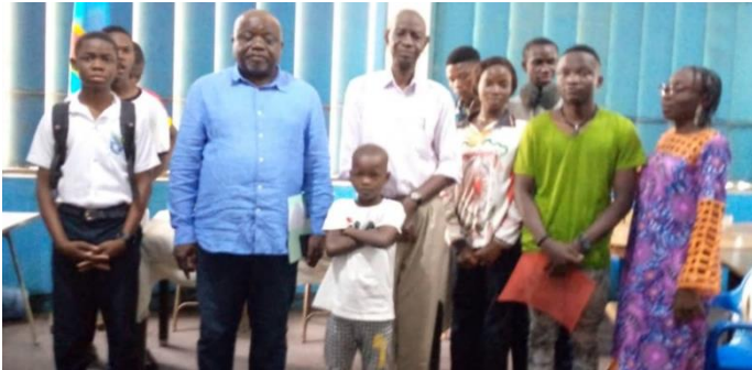
Photo d'ensemble des enfants et le bourgmestre de la commune de Matete