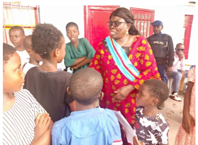
La remise de la note de plaidoyer à la bourgmestre de la commune de Kalamu