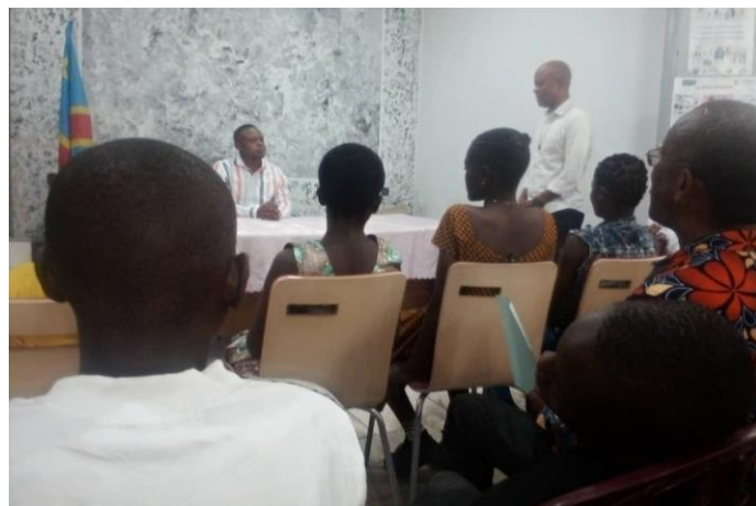
Les enfants reçus par le bourgmestre de la commune de Kasa-vubu