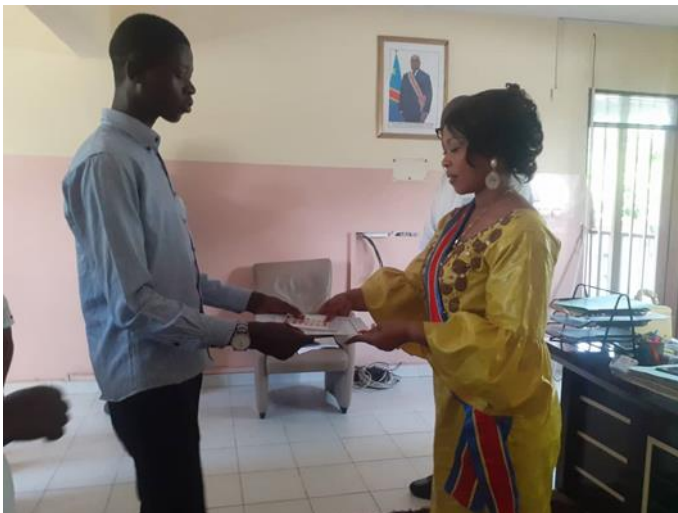
La remise de la note de plaidoyer à la bourgmestre de Kintambo