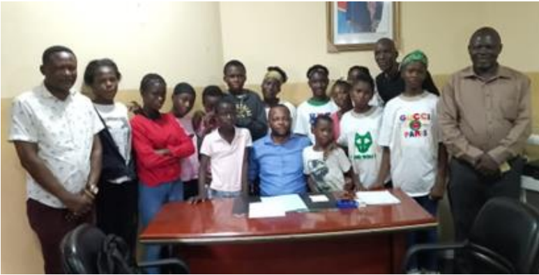
Photo d'ensemble des enfants et le bourgmestre de la commune de Bumbu